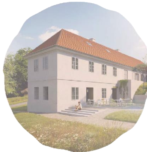
Proměna usedlosti Cibulka v centrum excellence