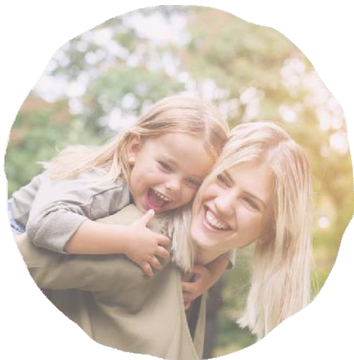
Rozvoj dětské paliativní péče