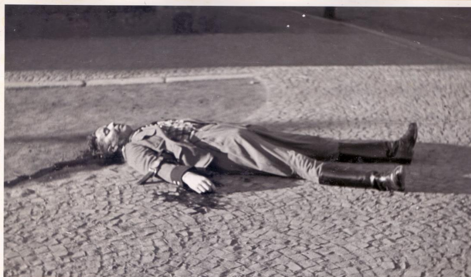
Aufnahme nach der Todesfeststellung durch den tschechischen Polizeiarzt.