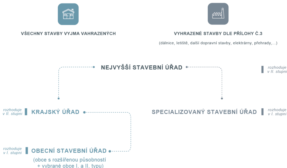
Obrázek 1 – Schéma struktury stavebních úřadů

Vyhrazené stavby bude podle PN v prvním stupni povolovat Specializovaný stavební úřad (§ 32). Odvolacím orgánem vůči němu bude Nejvyšší stavební úřad jako ústřední orgán státní správy (§ 31). Nejvyšší stavební úřad bude zároveň nadřízeným orgánem krajských úřadů ve věcech povolování staveb a územního plánování.