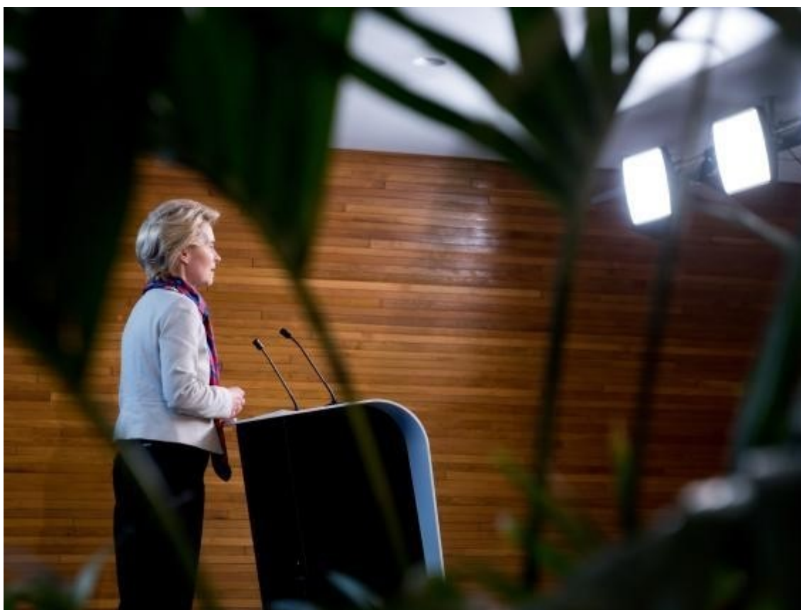
Ursula von der Leyen na plenárním zasedání EP

Předsedkyně von der Leyen usiluje o to, aby každý, kdo pracuje, vycházel se svou mzdou důstojně a dobře bez ohledu na to, kde pracuje . Byla zahájena první fáze konzultací se sociálními partnery, podniky a odbory, v níž se intenzivně řeší otázka výše spravedlivé minimální mzdy. Každý návrh minimální mzdy bude odrážet vnitrostátní tradice (kolektivní smlouvy, předpisy). Některé státy mají skvělé systémy a Komise by chtěla dostatečné pokrytí mechanismů ve všech členských státech. Ve sdělení o budování sociálně silné Evropy pro spravedlivou transformaci je představeno řešení, jak přispěje sociální politika k řešení výzev. Navrhuje opatření na úrovni EU a bude se snažit získat zpětnou vazbu na všech úrovních v oblasti zaměstnanosti a sociálních práv. (EC 6)