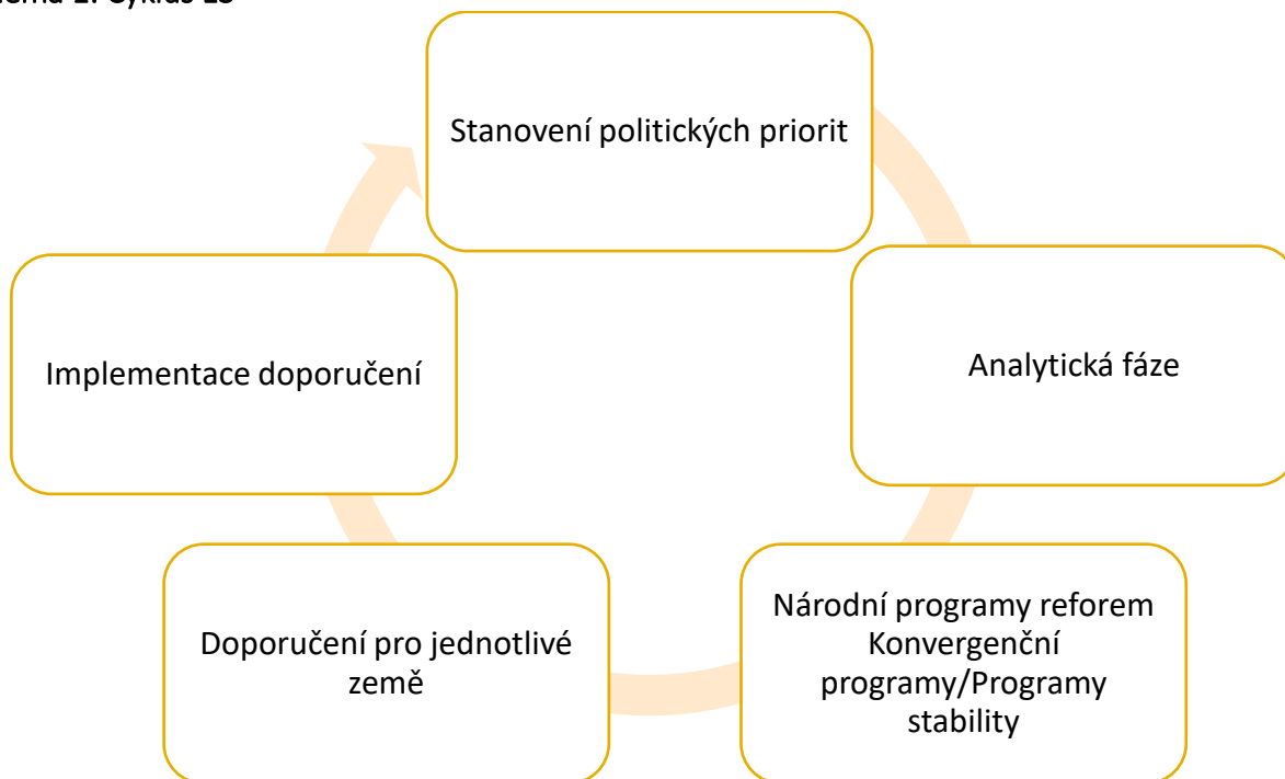
Schéma 1: Cyklus ES

Třetí fáze do konce roku je již fáze provádění, tzv. národní semestr. Členské státy by měly doporučení zapracovat do návrhů svých rozpočtů. Členské státy eurozóny předkládají Komisi a Euroskupině návrhy svých rozpočtových plánů ( Draft Budgetary Plan, DBP ) do poloviny října. Komise ve stanovisku DBP hodnotí jejich soulad s požadavky Paktu stability a růstu ( Stability and Growth Pact, SGP ). 10